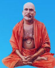
గురు మశయాళ స్వామి